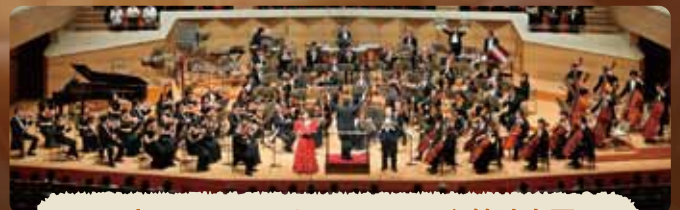
日本ニューフィルハーモニック管弦楽団

5市(武蔵野市、三鷹市、小金井市、国分寺市、国立市)に 在住または在学の小学生・中学生及び引率の保護者 ※未就学児の同伴はご遠慮ください。小学生は必ず保護者の方が引率してください。 ※中学生の方は、引率の保護者無しでもお申込みできます。